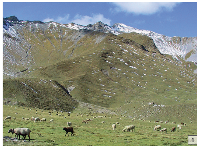
1 En Suisse, la garde extensive de petits ruminants est très répandue.

En Suisse, la garde de petits ruminants est en première ligne une activité exercée à titre accessoire, comme hobby ou pour le plaisir procuré par les animaux. Elle ne constitue que rarement le gain principal d'une exploitation agricole. Il s'agit de plus en plus d'une alternative à la garde de bétail laitier dans l'exploitation extensive des surfaces herbagères. Les petits ruminants sont des animaux d'instinct grégaire et se distinguent en outre clairement par leur tempérament des autres animaux de rente que sont les bovins, les chevaux ou les porcs. Le type de garde varie selon l'espèce. Ainsi, le tempérament et le comportement alimentaire sélectif de la chèvre pose des exigences élevées à la sécurité des clôtures. Des animaux sauvages comme les cervidés sont très craintifs et forment des hardes généralement compactes. Quand les petits ruminants sont malades, reconnaître la maladie peut parfois prendre du temps; si c'est le cas, la maladie est alors déjà bien avancée et les animaux malades commencent à s'isoler du troupeau. A ce point, la maladie peut alors sembler évoluer très rapidement et dramatiquement. Il arrive aussi que les maladies infectieuses se propagent dans le troupeau de manière presque inaperçue et évoluent en peu de temps en un problème enzootique, qui entraîne des pertes importantes, tant au niveau des animaux qu'au plan économique.